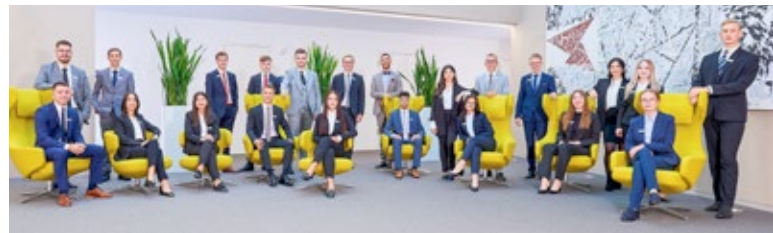
Das Gruppenbild des Ausbildungsjahrgangs 2022 der Kreissparkasse Tuttlingen.

Tuttlingen / Landkreis Tuttlingen (mm). Ausbildung und Studium bei der Kreissparkasse Tuttlingen: Mit über 500 Mitarbeiterinnen und Mitarbeitern arbeiten wir an optimalen Lösungen für die finanzielle Freiheit unserer Kunden. Dafür brauchen wir kluge Köpfe mit dem Herz am rechten Fleck. Deine Kreativität und Vielseitigkeit ist hierbei gefragt - jeder Tag bringt individuelle Kundenbedürfnisse und Wünsche mit sich, die es zu erfüllen gilt. Für deine Karriere bieten wir dir ausgezeichnete Ausbildungs- und Studienmöglichkeiten - von der Ausbildung bis zum Master. Dein Ausbildungsplan wird individuell nach deinen Stärken für dich erarbeitet. Gemeinsam entwickeln wir nach der Ausbildung oder dem Studium ein passendes Weiterbildungskonzept. Die Mitarbeiter sind unser wichtigster Erfolgsfaktor. Deshalb bieten wir auch attraktive Sport- und Gesundheitsangebote, Vergünstigungen auf unsere Produkte, übertarifliche Vergütung und eine Prämie für deine Ausbildung. Wir sind im gesamten Landkreis Tuttlingen vertreten. Angefangen bei finanzieller Flexibilität bis zu den eigenen vier Wänden oder Firmengründungen - wir bieten einfache und verständliche Lösungen und wir fördern die Wirt-