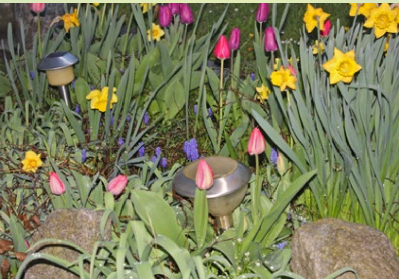
Bunte Frühlingspracht.

Tuttlingen / Region (mm). Erfreuen die ersten Frühlingsblumen in den Gärten, steigen die Temperaturen und die Tage werden länger, lockt es auch die heimischen Hobbygärtner wieder zur Gartenarbeit. Trotz schönem Frühlingswetter warnt der Naturschutzbund (Nabu) jedoch davor, zu früh im Garten mit den ersten Arbeiten zu beginnen. Wissend, das mit den ersten warmen Tagen ab Frühlingsbeginn der grüne Daumen juckt, raten Experten des Naturschutzbundes Baden-Württemberg zur Zurückhaltung bei der Neubepflanzung und dem Rückschnitt, da viele Schmetterlinge und andere Insekten erst später im Frühling aus der Überwinterung erwachen und so gestört werden. Die Insekten haben unterschiedliche Taktiken wie sie die kalte Jahreszeit überstehen. Viele verpuppen sich, einige überleben als Raupe am Boden oder sogar als Ei an einen Blumenstängel geheftet. Sie schlüpfen erst, wenn die Pflanzenblätter austreiben. Aber auch die Pflanzen brauchen das Herbstlaub und die abgestorbenen Pflanzenteile noch, um ausreichend vor den Witterungsbedingungen geschützt zu sein. Wenn es über einen längeren Zeitraum keinen Bodenfrost mehr gibt und die Temperaturen beständig über mehrere Grade im Plus liegen, kann die Gartenpflege mit der Auflockerung des Bodens, dem Herrichten sowie Bepflanzen der Gemüse- und Blumenbeete beginnen.