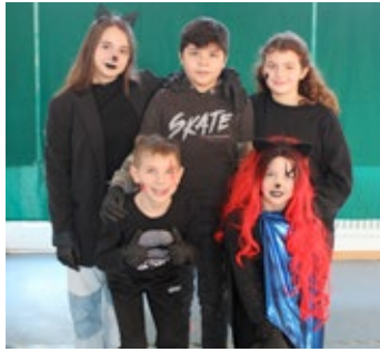
Die Donauschule Nendingen setzte die Kunst- und Medienprojekte „Unterwasserlandschaft – Der kleine Wassermann“ um.

Tuttlingen-Nendingen (mm). An der Donauschule Nendingen wurde ein Medienprojekt für Schüler erfolgreich umgesetzt. Letztes Jahr verwandelten die Schüler das Schulhaus-Foyer in eine Unterwasserlandschaft. In