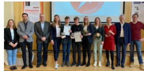
Gruppenbild mit Ausgezeichneten und Juroren bei der Preisverleihung „Jugend forscht“.