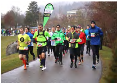
Der beliebtgewordene Silvesterlauf der Tuttlinger Sportfreunde (TSF) geht heuer in die 10. Auflage.

Tuttlingen / Region (sch). Der Silvesterlauf Tuttlingen steht auch in diesem Jahr wieder als Laufevent zum Jahresende im Mittelpunkt der gesamten Region und weit darüber hinaus – und das bereits zum zehnten Mal. Von den Bambini über die Schüler bis hin zu den Erwachsenen gibt es mehrere Wettbewerbe für den sportlichen Jahresausklang am 31. Dezember ab 11 Uhr in Tuttlingen, organisiert von den Tuttlinger Sportfreunden (TSF). Der exakt fünf Kilometer lange und flache Rundkurs ist offiziell vermessen und damit bestenlistenfähig. Zur Auswahl stehen neben dem Lauf über fünf Kilometer auch der Chiron-Zehn-Kilometer-Lauf. Die beliebte Strecke führt entlang der Donau durch Tuttlingen und bietet sich für einen schnellen Lauf und persönliche Bestzeiten hervorragend an – genauso zum Anfeuern für die Zuschauer, die für eine ausgelassene Stimmung entlang der Strecke sorgen werden. Wenn der Startschuss des Silvesterlaufs Tuttlingen fällt, sind auch die Walker mit einem Fünf-Kilometer-Wettbewerb und mehrere Bambini- und Schülerläufe wieder mit dabei. INFO Die Anmeldung ist bis zum 25. Dezember 2023 online auf www.silvesterlauf-tuttlingen.de möglich. Dort gibt es auch alle Infos und die Ausschreibung. Zum Jubiläumslauf gibt es für alle Voranmelder (außer Bambini- und Schülerläufe), bis zum 17. Dezember online, ein Running-Shirt gratis dazu.