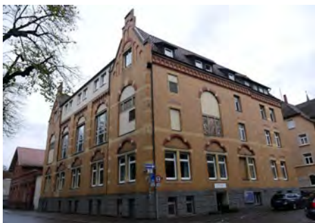
Geht in den Besitz der Stadt Tuttlingen: das Evangelische Gemeindehaus in der Gartenstraße.

Gemeinde zu groß geworden ist. Gleichzeitig kann die Musikschule in großzügigere Räume ziehen, und verschiedene musiktreibende Vereine bekommen die Probe- und Lagerräume, nach denen sie schon lange suchen. Ort für Musikschule und Vereine „Ein stadt-bildprägendes Haus mit großer historischer