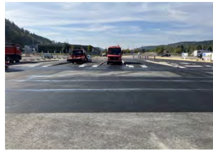
Im Zuge des Neubauprojekts „Stadtbahnhof“ wurde ein provisorischer Busbahnhof am Bahnhof in Tuttlingen eingerichtet. Ab 11. Dezember 2023 halten alle Busse nur noch auf dem ehemaligen Bahnhofs-Parkplatz.

Tuttlingen / Landkreis (mm). ÖPNV-Nutzer müssen am Tuttlinger Bahnhof umstellen: Ab 11. Dezember halten alle Busse am provisorischen Busbahnhof auf dem ehemaligen Parkplatz. Der Wechsel ist zeitgleich mit der Einführung des Winterfahrplans. Ab Frühjahr wird dann im Rahmen des Projekts Stadtbahnhof der Bahnhofsvorplatz neu gestaltet. Der Umbau des Bahnhofsvorplatzes zum neuen Knotenpunkt ist einer der wichtigsten Bausteine des Projekts Stadtbahnhof. So werden unter anderem moderne Bussteige und Ange-