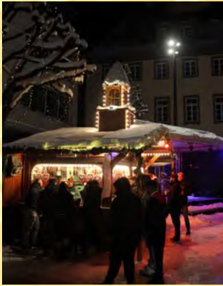
Abendliche Lichterstimmung fehlt beim PROTUT-Adventstreff auf dem Tuttlinger Marktplatz nicht.

Als beliebter Treffpunkt in der Vorweihnachtszeit hat sich der PROTUT-Adventstreff auf dem Marktplatz etabliert. In diesem Jahr können die Besucher in der weihnachtlich geschmückten Innen-